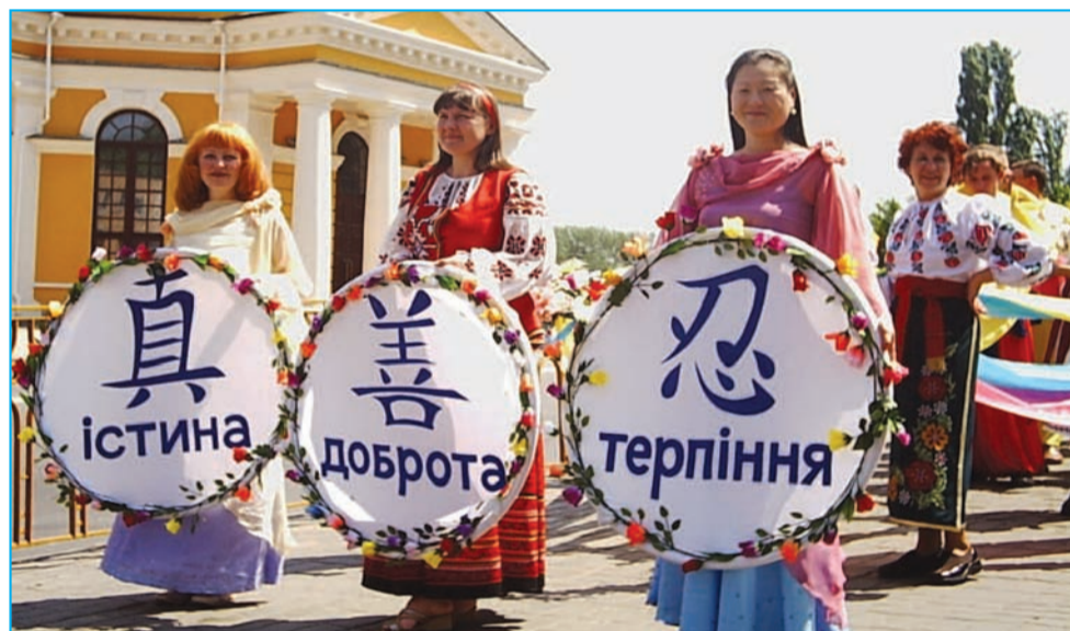
День Киева - 24 августа 2004. Праздничное шествие последователей Фалунь Дафа по улицам столицы

В результате повышения нравственного уровня, а также практики упражнений, достигается коренное оздоровление организма человека. Многие уже не нуждаются в