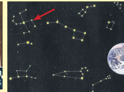
Любой человек может увидеть левее созвездия Макоши (Б.Медведицы) созвездие Свастики