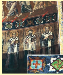
Мозаика, правая часть алтаря, 1037 г. Софийский собор, Киев