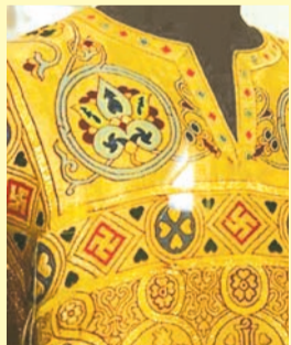
Православное церковное одеяние средних веков. Россия

символ 4-х основных сил, 4-х сторон света, стихий, времён года и алхимической идеи превращения элементов. Однако есть ещё одно малоизвестное значение свастики, но не менее верное и даже точное — отображение движения нашей спиралевидной Галактики. Вращение, с загнутыми лучами символа, демонстрирует условность подлёта или наблюдения за вращающимся скоплением звёзд сверху и снизу.