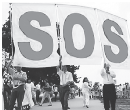
Люди по всему миру выступают против насильственного извлечения органов в Китае

Художник-скульптор верит, что если он сможет в своём творчестве выразить принцип «Истина Доброта Терпение», которому учит Фалуньгун, то это поможет сделать мир лучше и светлее.