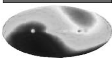
Графічні показання радіаційних хвиль руху галактики за 4 роки.

рунок не наносився просто так, кожному елементу візерунка відповідає визначене культове чи охоронне (оберегове) значення. Більш того: у самій російській мові, спорідненій із санскритом, зустрічаються слова, споріднені із свастикою, - такі як