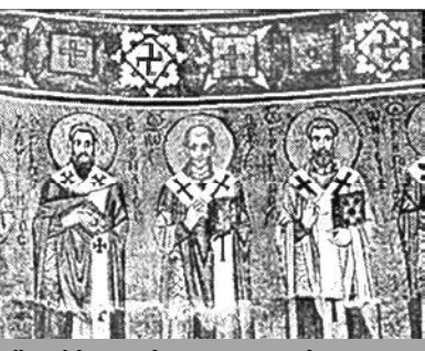
Мозаїка 11 століття в церкві «Святої Софії». Київ, Україна.

Цей історичний матеріал не має відношення до вчення Фалунь Дафа