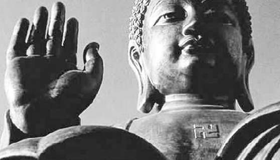
Найбільша статуя Будди у світі. (Китай)

плаття, рушники, листви на вікнах будинків і багато чого іншого. Свастика була головним і майже єдиним елементом праслов'янських орнаментів. У стародавності жоден візе-