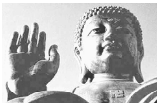
Самая большая статуя Будды в мире. Китай

При Петре I, стены его загородной резиденции были украшены свастиками. Потолок тронного зала