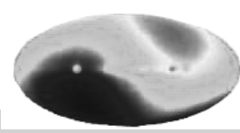
Графические показания радиационных волн движения галактики за 4 года.

мы видим, что схема движения большинства галактик имеет знак свастики (фото1), а другие имеют форму знака тайци (фото2).